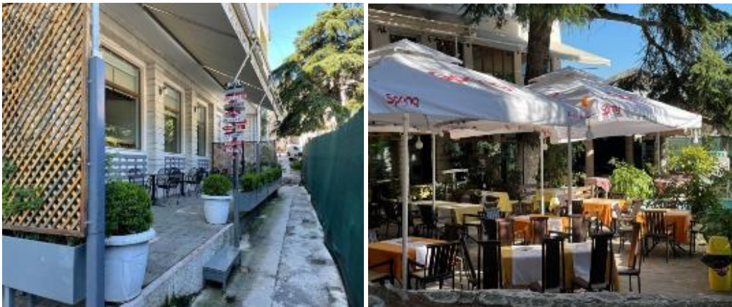
Figura4:Sheshi tek Bashkia