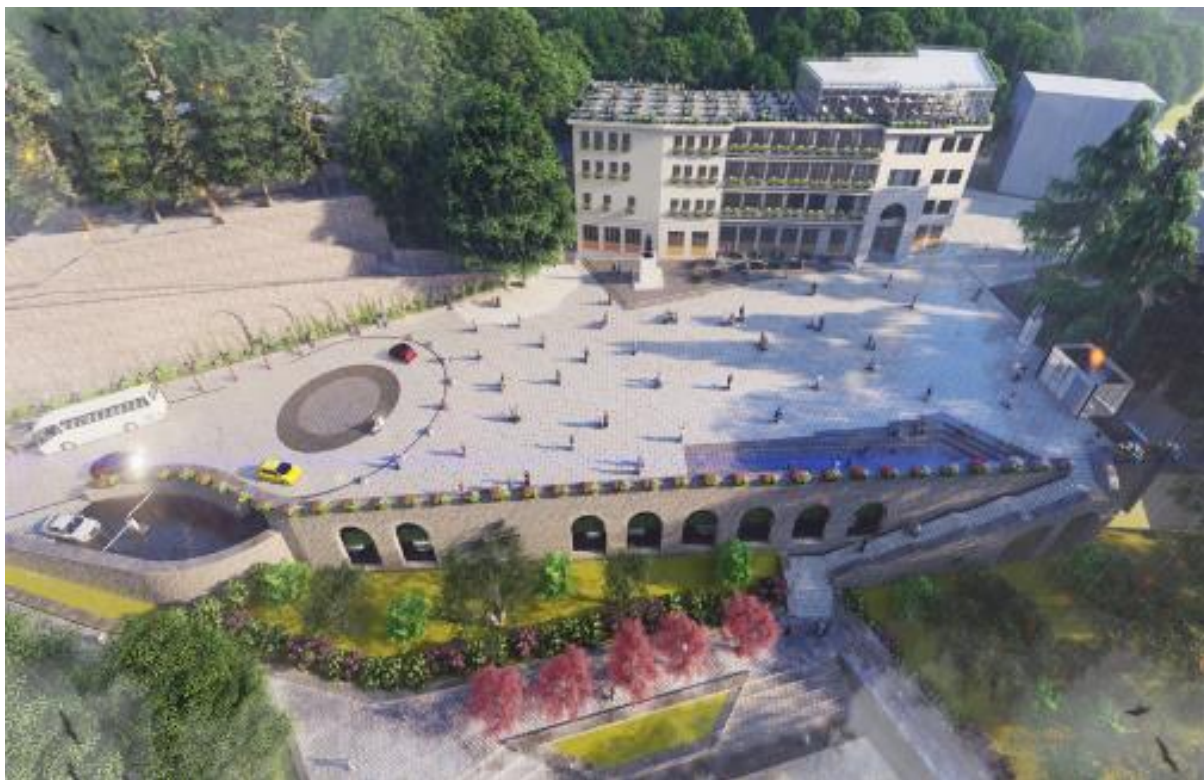
Figura2: Opamje e projektit të propozuar

Sheshi “Çerçiz Topulli” u krijua në fillim të viteve '60, dhe u konceptua si shesh publik urban dhe si i tillë shërbeu deri në fillim të viteve '90. Sheshi që mban monumentin e Çerçiz Topullit ndodhet në skajin lindor të Pazarit të Vjetër të Gjirokastrës.