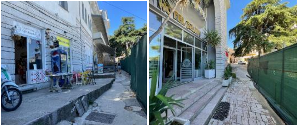
Figura3: Sheshi “Çerçiz Topulli”.