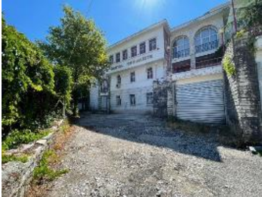
Figura5:Sheshi “Shtëpia e Pionierit” dhe Lidhja mes dy shesheve