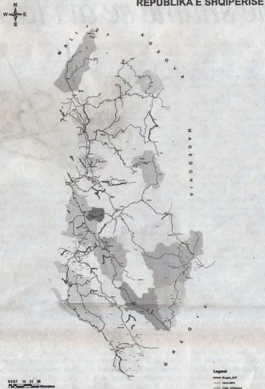
Harta treguese e rugeve dytesore dhe lokale ne zbatim nga FSHZH per vitin 2010 REPUBLIKA E SHQIPERISE

sionit, gjë që duket në çdo hap. Janë dhjetëra zyrtarë që kanë vizituar qelitet e burgut për shkak të korrupsionit. Pra, toleranca ndaj një shfaqjeje të tillë, ka qenë zero. A mund të na tregojnë të majtët, sikur edhe një rast të vetëm, kur të kenë arrestuar funksionarë e zyrtarë të lartë? Nuk mund të thotë asgjë, pasi nuk ka pasur asnjë rast të tillë. Mos vallë nuk ka pasur korrupsion në qeverisjen e tyre? Mos vallë, me të vërtetë, Edi Rama ka 2 mijë euro? Të besosh këtë është një marrëzi e madhe. Korrupsioni në kohën e qeverisjes socialiste ka qenë shumë i madh. Ndryshimi midis qeverisjes së majtë dhe asaj të koalicionit të djathtë, qëndron në faktin se të parët e lanë të lirë korrupsionin në rrugën e vet, ndërsa të dytët i kanë prishur qetësinë dhe ai nuk gjen vend ku të rrijë. Shumica e qeveritarëve të Partisë Socialiste janë bërë milionerë dhe kjo në sajë të korrupsionit që kanë bërë në kurriz të popullit shqiptar.