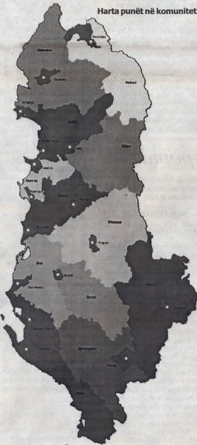
Harta punët në komunitet

sepse shohin interesat kombëtare. Pozita druhet të ngrejë dhe një shqetësim të vogël, se opozita hidhet përpjetë. Kryeministri Berisha, është i pari kryeministër në Shqipëri, që